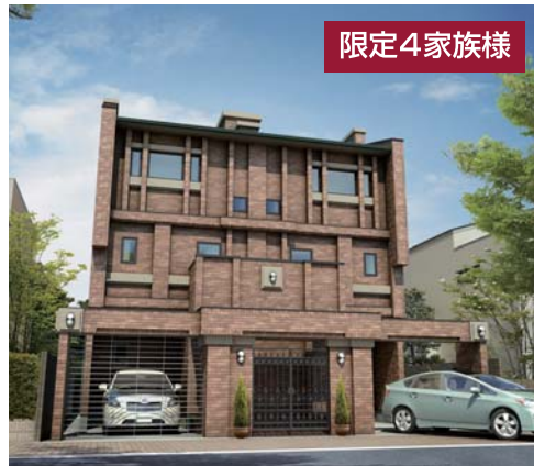
※オーダー・デュブイメージベース(写真は推奨プランの図面を基に描き起したもので実際のものとは異なる場合がございます。オプション含む。)

A2号地価格 1,040万円 + 推奨プラン価格 1,890万円(税込) = A2号地に推奨プランを建築した場合 2,930万円(税込)